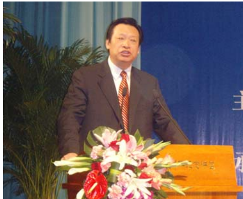
江西省人民政府省长吴新雄参与协会活动并演讲

在吴新雄省长的演讲之后，中国人民大学金融与证券研究所所长吴晓求教授、清华大学文化产业研究中心主任熊澄宇教授、中国经济研究中心（CCER）副主