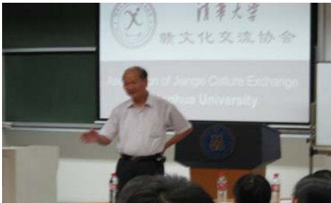
潘际銮院士平易讲演给大家留下极深印象

2007年9月28日,清华大学赣文化交流协会举办“2007江西籍新生迎新座谈会”,邀请中科院院士暨首任南昌大学校长潘际銮教授、清华大学党委宣传部长邓卫教授、清华大学江西招生组组长陈怀璧教授与92名清华大学2007