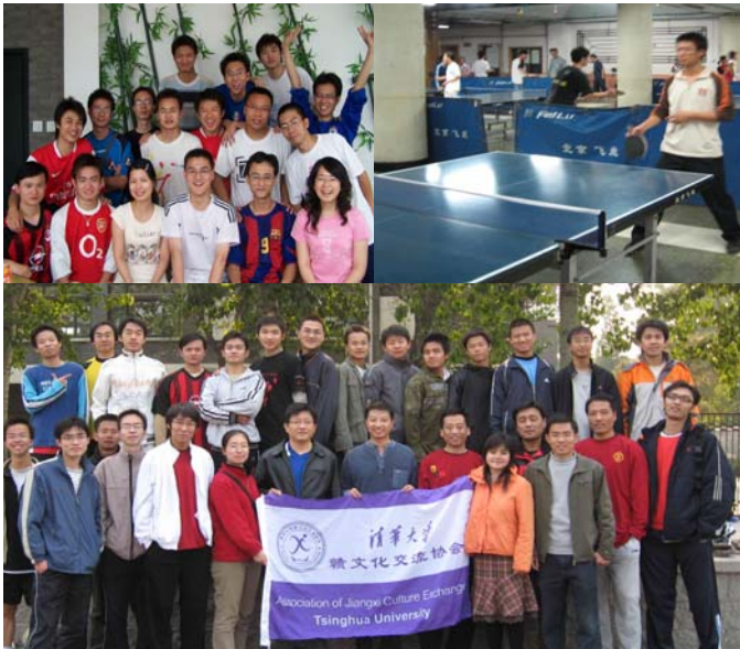
协会感情建设活动丰富多彩

协会通过足球、羽毛球、乒乓球及集体出游等多种方式致力于协会内部感情建设，目前协会已经组建清华江西足球队、羽毛球队、乒乓球队等。协会足球队还曾与北京大学江西足球队、江西清华泰豪企业足球队、清华大学河南足球队举行多场足球