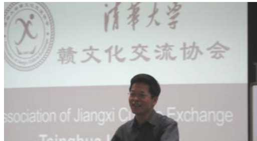
协会指导老师、校党委宣传部部长

级新生欢聚一堂,师生共话大学学习生活,并就大家关心的家乡教育发展等问题进行了热烈的讨论。协会希望通过每