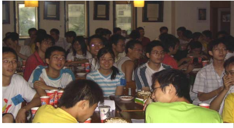
欢聚一堂共叙乡情

2007年7月9日，清华大学赣文化交流协会举办“2007年清华江西籍学子聚会暨毕业生欢送会”，近150名清华江西籍学子欢聚一堂共叙乡情，畅谈美好的未来。