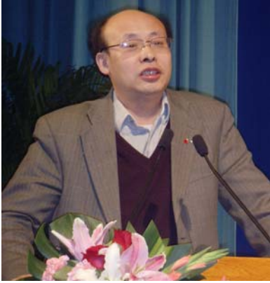
清华大学文化产业研究中心主任熊澄宇教授参与协会活动并作演讲