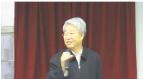
现场嘉宾之一：江西省原副省长孙希岳先生

西历史的回顾与反思”一题作了一场生动而有趣的报告。演讲会场——经管学院伟伦楼508厅座无虚席，热烈的掌声和会心的笑声不绝于耳。