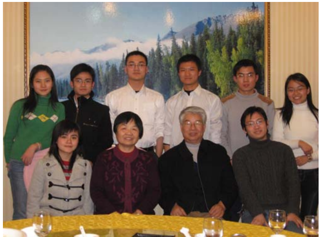
协会成员与孙老师（右二）和何老师（左二）合影

2007年12月8日，寒冷的冬天依旧挡不住协会成员激动而高兴的心情。我们赣文化交流协会部分成员非常荣幸的来到原江西省副省长、中国人民保险公司总经理，现任江西省方志敏研究会会长孙希岳先生的家中，和孙先生夫人、中国银行国际金融研修院原常务副院长何新华女士一起，就大学生的人生职业规划及江西的历史与发展等问题进行了深入的交流。孙先生颇有雅士之风，一进门，印入眼帘