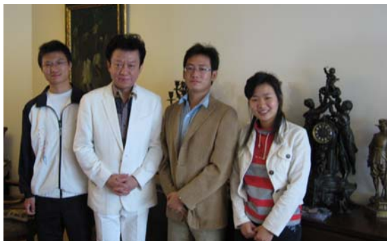
协会成员和盛中国老师合影

2007年9月30日，清华大学赣文化交流协会人员登门拜访著名小提琴艺术家盛中国老师，进行了愉快而深入的交流。盛老师对协会所做的工作表示了高度赞许并表示愿意为协会工作提供大力支持，鼓励协会人员继续努力，为家乡发展