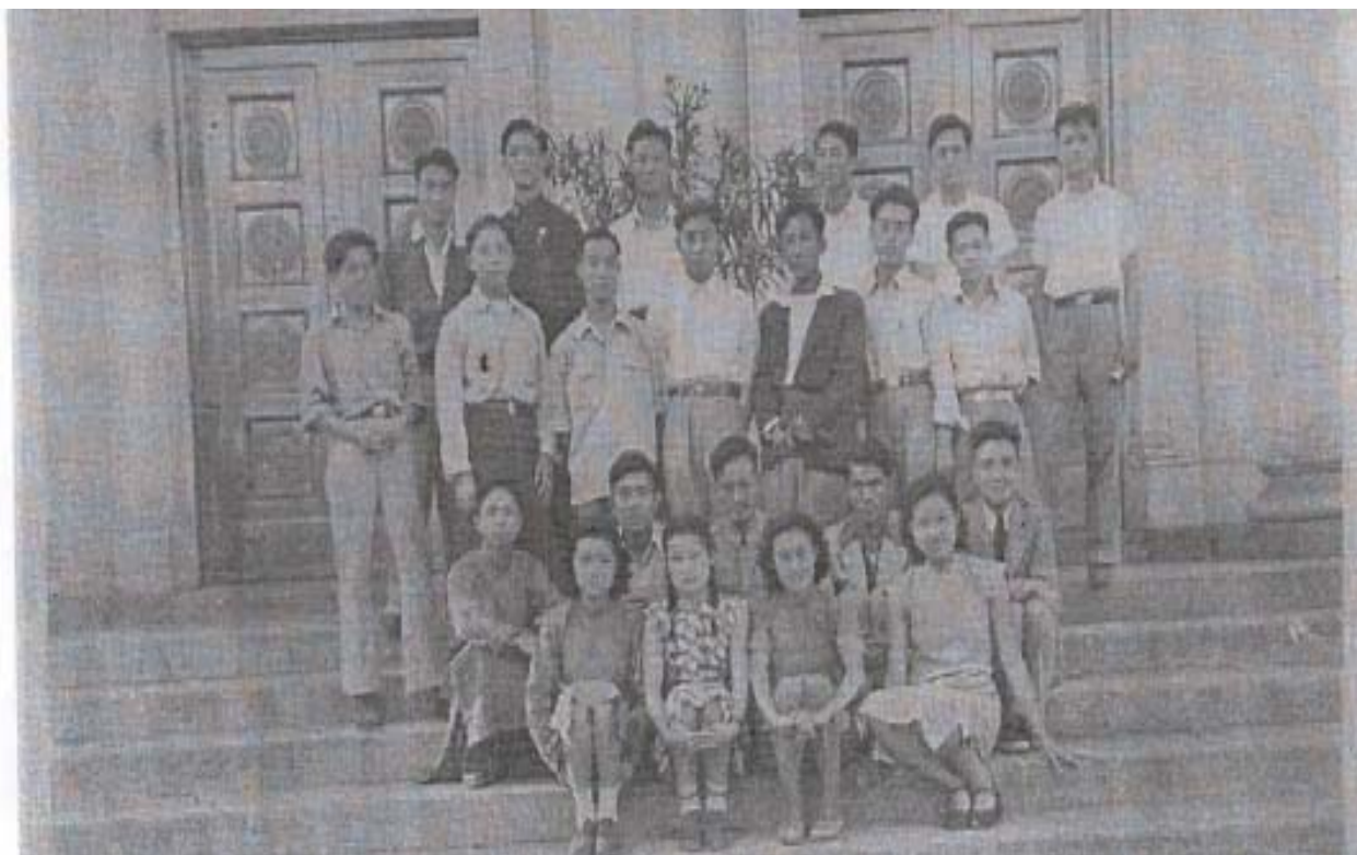
附：此图为清华大学江西籍同学 1945 年合影（潘际銓院士所赠，现惠存于我会）