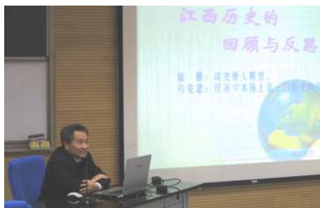
九三学社副主席、全国政协常委邵鸿老师 现场演讲反映热烈

十一月的清华园，乍寒还暖，最是动人。2007年11月17日，应清华大学学生赣文化交流协会的邀请，九三学社中央专职副主席、第十届全国政协常委、原南昌大学副校长邵鸿老师来到清华，就“江