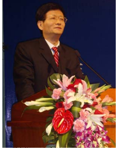
原中共江西省委书记，现任公安部副部长 孟建柱参与协会活动并作演讲

任姚洋教授、北京大学经济学院金融系副主任王一鸣等江西籍知名学者教授，就在工业化进程中保护生态环境、大力发展文化产业、建设社会主义新农村和江西旅游资源开发等方面话题，提出了进一步加快江西经济社会发展的建