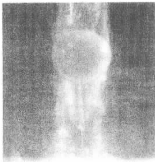
图 5 Taylor 柱。当一个物体在一个旋转流中运动时,它要带动一个与旋转轴平行的流体柱与它一齐运动,这张照片显示了当一个染色的塑胶液滴(半径 2 cm)在以 56 rpm 转速旋转的大水箱中上升时的流动情况 [17]

Taylor 在他晚年花费了许多时间研究流体与电场的相互作用,他最重要的贡献——(在 80